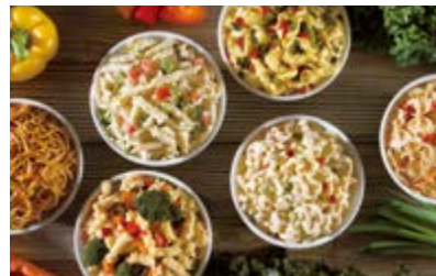
Hans Kissleが提供する安全・安心でおいしいデリ惣菜

当社は、Hans Kissleの提供する中食の安全性、おいしさ、ヘルシーさ、サービス等のさらなる向上に取り組むことで、多様化する消費者ニーズに積極的に応えていきます。