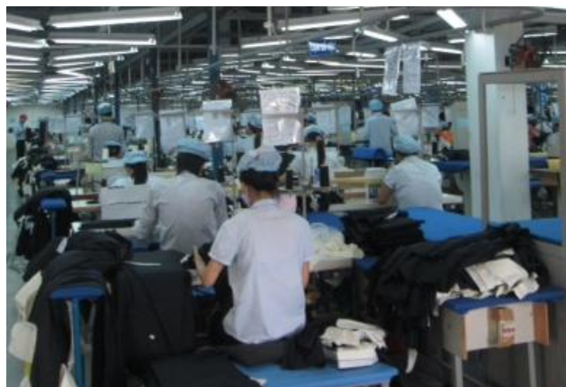
MIF製造委託工場(ベトナム)の縫製ライン及び検査風景

今後も、従来から顧客(製品納入先)ニーズが高かった品質・技術面に加えて、労働環境等のCSRの観点を含めた工場への働きかけを継続していきます。仕入先との日々のコミュニケーション、また、フィードバックを通じた「気づき」を重ねることで、適切な労働環境の構築を支援し、サステナブルな環境の実現を目指します。