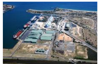
ウェスタンオーストラリア州バンバリー港およびウッドチップ加工工場全景

例えば、豪州植林事業・木材チップ加工事業においては、FSC™／PEFCに基づく環境管理・運用手順書を整備し、信用できる植林業者を選定しているか、薬剤による土壌汚染など自然破壊を起こしていないか、伐採跡地の植林義務を果たしているか等を定期的にチェックしています。また、当社関係会社である三井住商建材はFSC™／PEFC認証材やCoC認証材メーカーの製品売買に努めています。