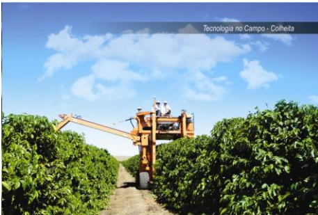
ブラジルで使用されるコーヒー豆の収穫機

コーヒーの生産は、霜害や干ばつ、乾季の降雨等の天災に大きく左右され、また需給バランスで価格が決まる相場商品のため生産者の収入が安定しないこと、またその多くはかつて植民地であった途上国で栽培されていることなどからサプライチェーンで取り上げられることが多い農作物です。