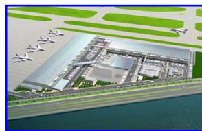
日本 羽田貨物ターミナル (100%)