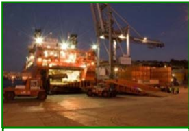
マルタ Valetta Gateway Terminal (55%)