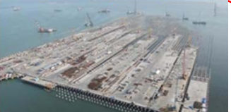
インドネシア Container Terminal One