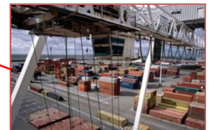
アルゼンチン Terminales Rio de La Plata (5%)