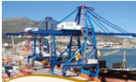
アルジェリア Bejaia Mediterranean Terminal (49%)