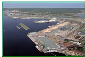
ラトビア Riga Universal Terminal (80%)