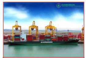
タイ Evergreen Container Terminal (49%)