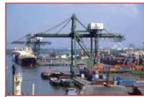
ベトナム Vietnam International Container Terminal (15.7%)