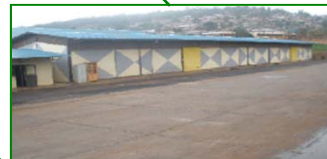
ルワンダ Magasins Generaux du Rwanda <INLAND> (75%)