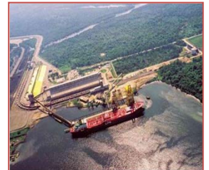
ブラジル VLI (20%)