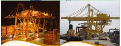
インドネシア Terminal 009 (51%)