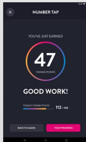
成果と脳活動ノルマ