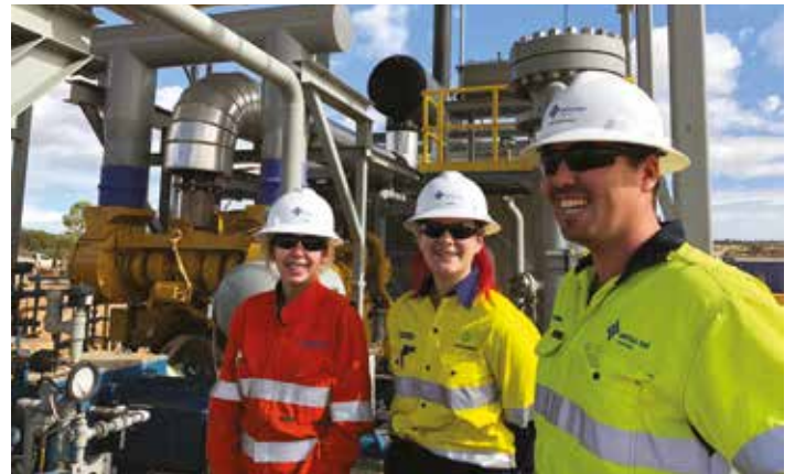
Waitsia Gas Project, Western Australia

当社は現在、オーストラリアにおける主要な輸出業者であり、投資家でもあります。私達の多様な事業ポートフォリオには、鉄鉱石、石炭、LNG、石油、ガス、発電、建設、及び、鉱業機械、化学品、鉄鋼製品、ウッドチップ、塩、食料、そして金融サービスなどが含まれ、金融やマーケティング、物流やプロジェクト管理にも精通していることにより、オーストラリア国内のみならず国際的な大手企業とパートナーシップを締結しています。長期間にわたり構築したネットワークを最大限活用するこ