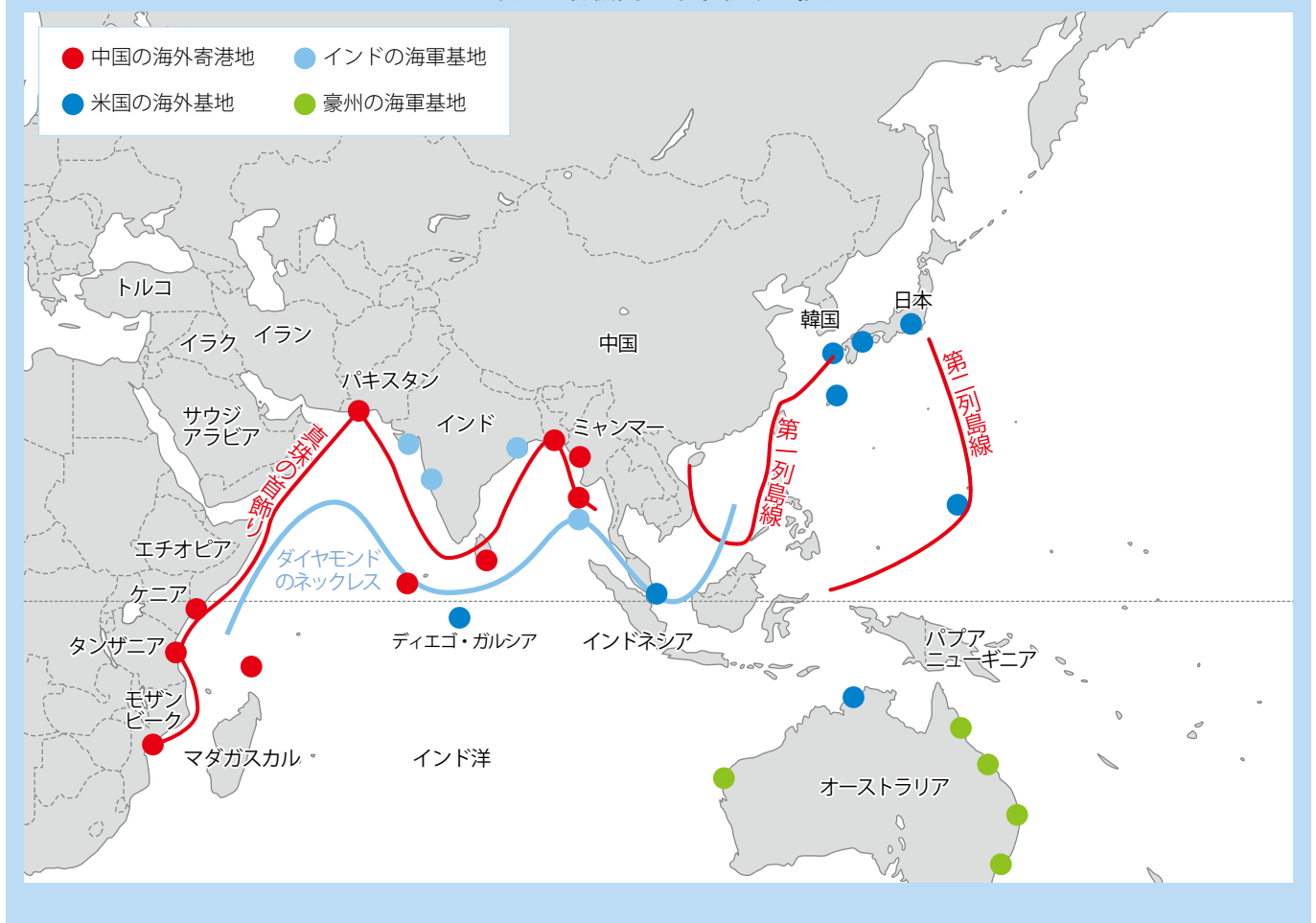
図表6 各機関の軍事戦略の接点

そのようななかで、中国とインドは、インド洋地域での友好国確保に積極的である。図表6は、インド洋とアジア太平洋地域において各国がどのように寄港地や基地を保有し、戦略的な接点を重ねているかを示している。中